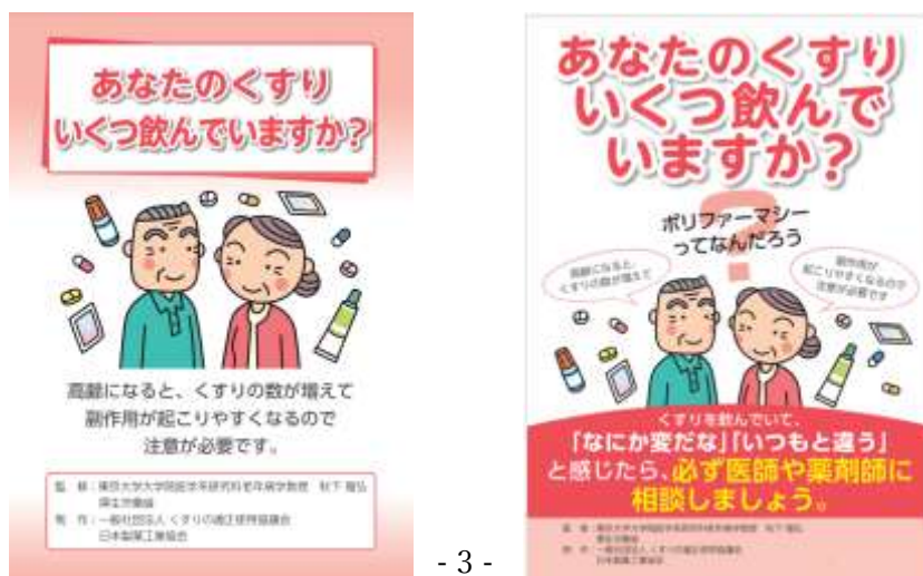
図1 一般社団法人くすりの適正使用協議会ウェブサイト「あなたのくすりいくつ飲んでいきますか」のパンフレット(図左)、ポスター(図右)のイメージ

https://www.rad-ar.or.jp/knowledge/post?slug=polypharmacy